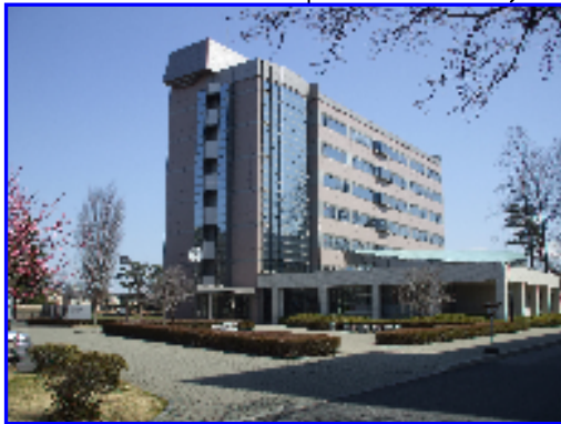
学際先端システム学専攻棟(10号館) 5階 熱流動解析研究室